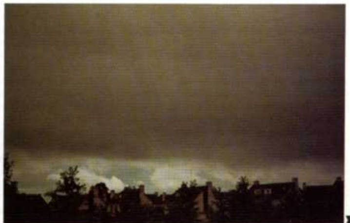
Fig. 3. Onder een zeer dikke wolk is de lucht donkergrijs tot zwart.

Het is een algemeen optredend verschijnsel dat het uiterlijk buiten en binnen een hoeveelheid deeltjes die tot strooiing aanleiding geven, dus van het naar buiten gestrooide (weerkaatste) licht en het doorgelaten licht, tegengesteld is. Het uit zich bijvoorbeeld ook duidelijk in een met stofdeeltjes gevulde dampkring. Vooral bij laagstaande zon is de hoeveelheid licht die dan verstrooid wordt aanzienlijk. Het doorgelaten licht verliest diens gevolg intensiteit; het grootste verlies is ook hier in het blauw. Het gevolg is een roodkleuring van de zon, hetgeen juist de kleur is die op zijn weg naar de waarnemer het minst verstrooid is en dus overblijft. Als dit licht op verre wolken wordt weerkaatst, verliest het op zijn terugweg naar de waarnemer nog meer van zijn helderheid, vooral in het blauw. Het gevolg is de dieprode gloed die