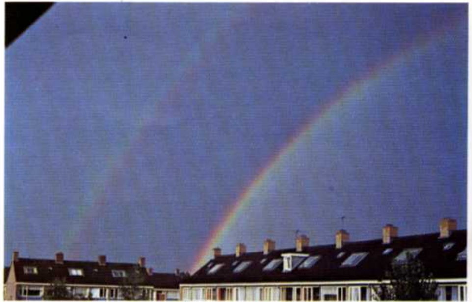
Fig. 6. De regenboog verschijnt in een met druppels gevulde lucht tegenover de zon. Let op de kleurvolgorden en de donkere band tussen de bogen.

de druppel ondergaat voor het uittreedt, en dat deze lichtwegen ook voor regenbogen kunnen zorgen. Inderdaad zijn deze wegen mogelijk, maar door de vele weerkaatsingen die het heeft ondergaan is het licht dermate zwak, dat het in alle gevallen overstraald wordt door een van de bovengenoemde bijdragen. Hierdoor zijn lichtverschijnselen van deze bijdragen nooit te zien.