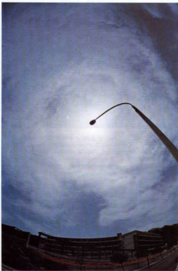
Fig. 7. (links): In hoge bewolking, die uit ijskristallen bestaat tekent zich hier de kleine kring (straal = 22^\circ ) af. De zon bevindt zich achter de 'kop' van de lantarenpaal. (rechts): Ook rond de maan verschijnt regelmatig een halo (=lichtkring) zoals de tijdopname van ongeveer een halve minuut laat zien. De groenige tint van de hemel is niet echt, maar een gevolg van de relatief lange belichtingstijd.

* Dit artikel is ook verschenen in 'Intermediair' 13 no. 45 (11 nov. 1977)