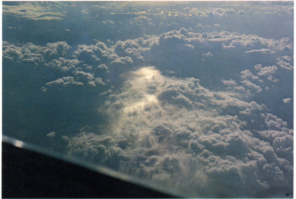
Fig. 1 De onderzon, een heldere witte vlek op de bewolking, gezien vanuit een vliegtuig.

Hierdoor is het wolkengebied dat oplicht door de verschijning van een halovorm in het laatste geval vele malen groter. Een