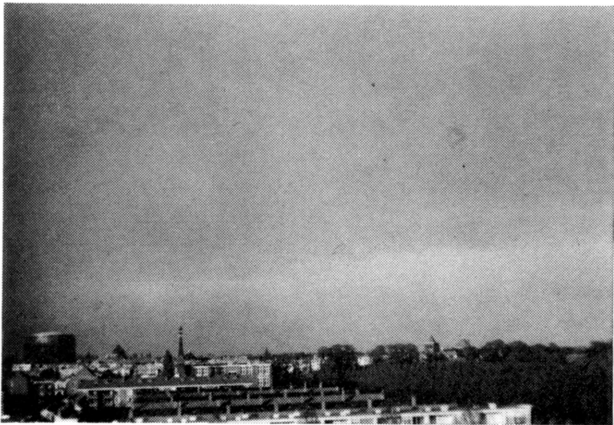
Fig. 3. Dezelfde regenboog, gefotografeerd door een polaroid filter loodrecht op de trillingsrichting van het licht.