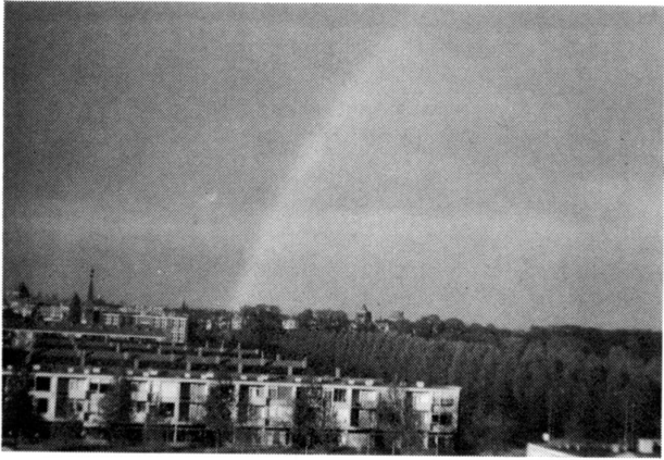
Fig. 2. Dezelfde regenboog, gefotografeerd door een polaroid filter evenwijdig met de trillingsrichting van het licht.